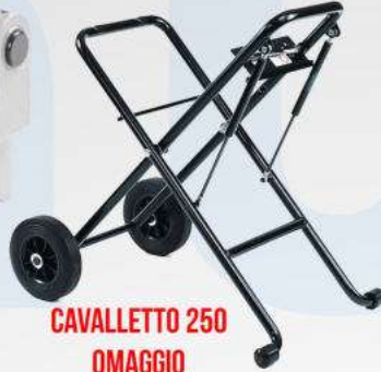
CAVALLETTO 250 OMAGGIO