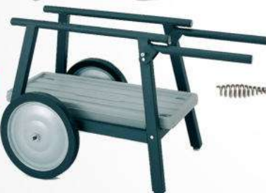
CAVALLETTO 150 OMAGGIO